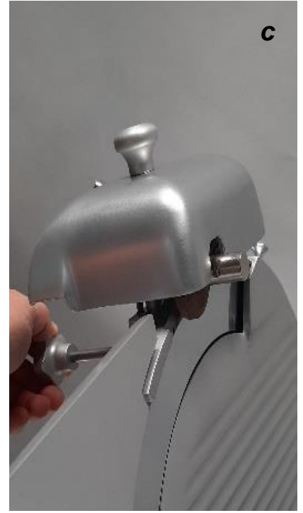
Resserrer le bouton. La pierre ne doit pas toucher la lame lors du resserrage.