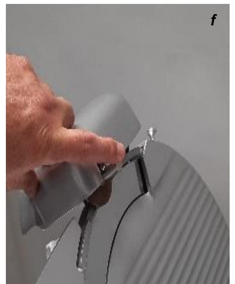
Appuyer 1 seconde sur le bouton de morfil