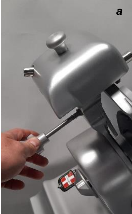
Desserrer le bouton