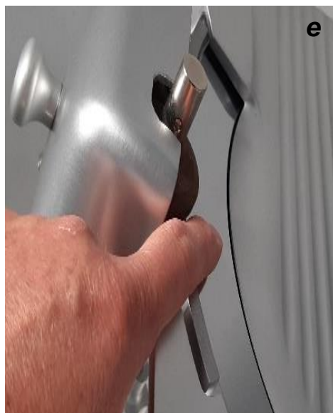
Vérifier si le morfil apparaît