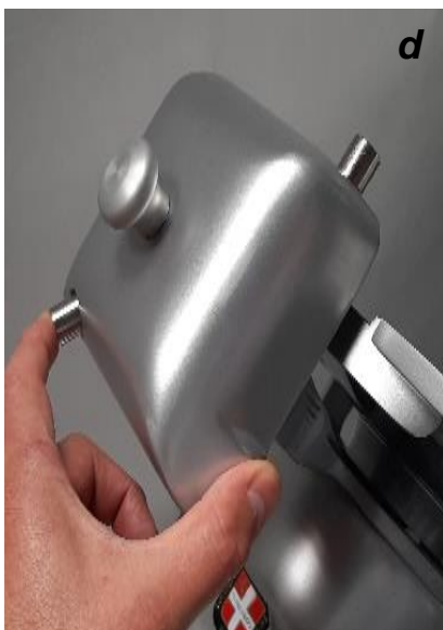
Appuyer 5 secondes sur le bouton d'affûtage