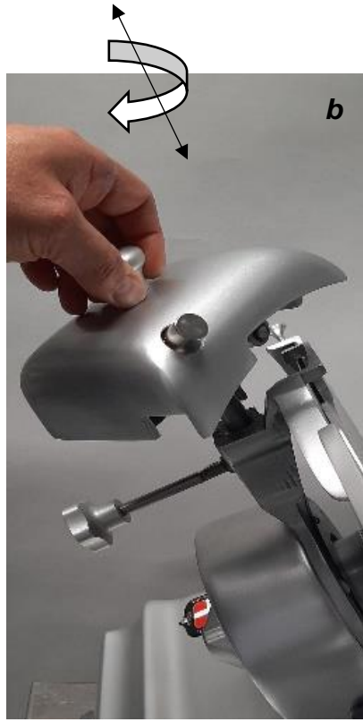
Retirer l'affûteur et le tourner à 180°